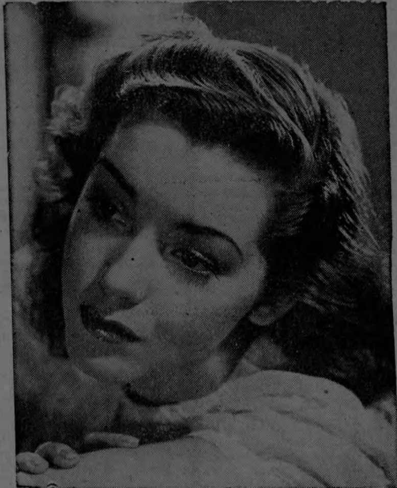
La adorable estrella MARSHA HUNT, es, según Max Factor Jr., una de las actrices de Hollywood que más atención ponen en el cuidado de todos los detalles de su arreglo personal y que, por lo tanto, merece ser imitada